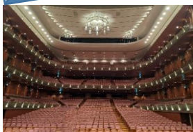
びわ湖ホールステージより

運営部は、大会会場となるびわ湖ホールをはじめ、ピアザ淡海、コラボしが21、大津市民会館、大津市勤労福祉センターの5会場を下見し、大会当日への準備を進めています。特に、メイン会場となるびわ湖ホールは、ホワイエから琵琶湖を一望できるロケーションや、大ホールの素晴らしい音響設備が魅力です。ステージから見渡す4階層客席の迫力は、盛況な大会開催を予感させます。現在、参加者受付から会場への動線、控室の配置など、スムーズな運営のための計画を進めています。